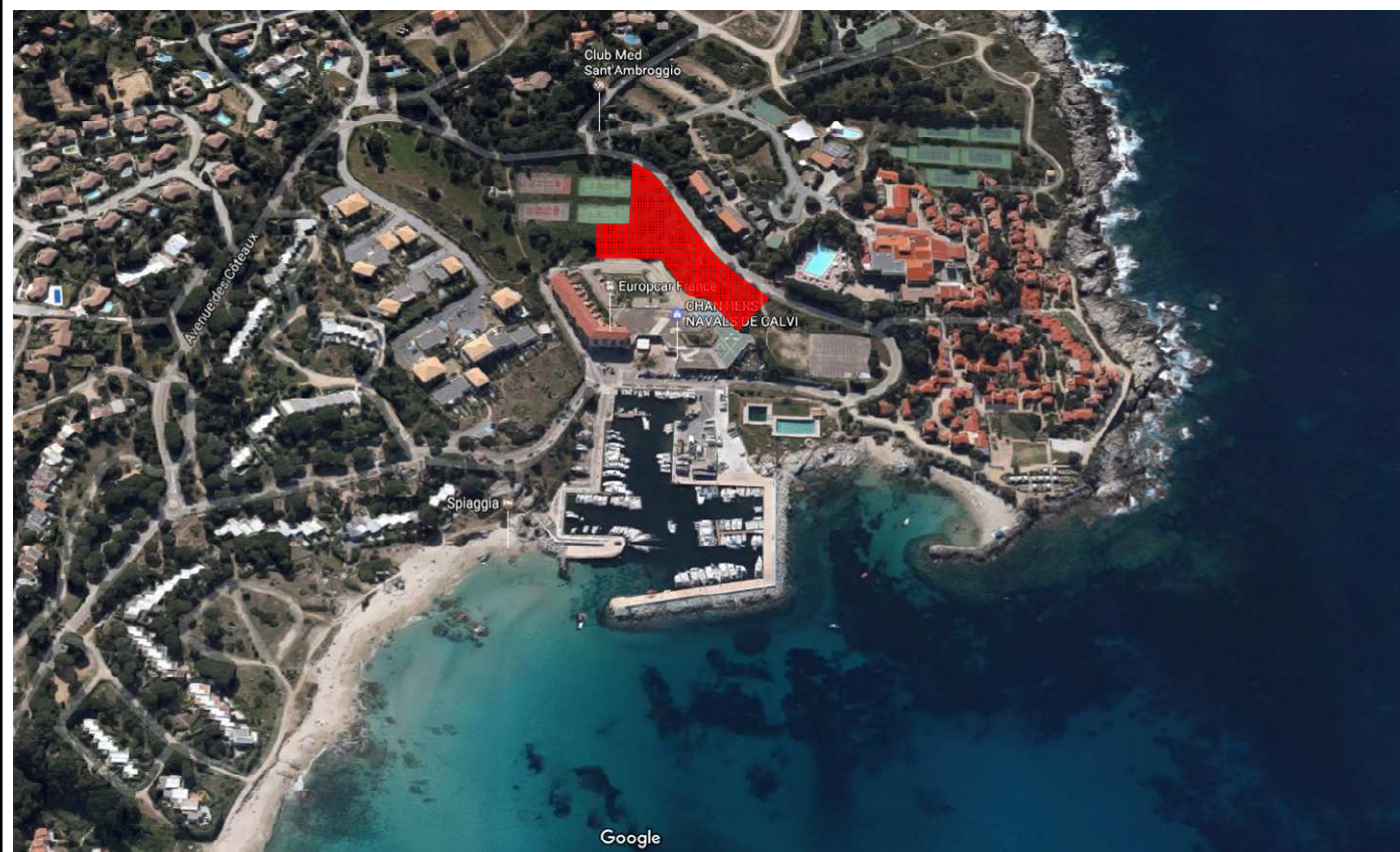
Situation géographique du Projet